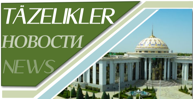
A SCIENTIFIC AND PRACTICAL CONFERENCE WAS HELD

12-nji maýda türkmen halkynyň Milli Lideri, Türkmenistanyň Halk Maslahatynyň Başlygy Gurbanguly Berdimuhamedow Malaýziýanyň