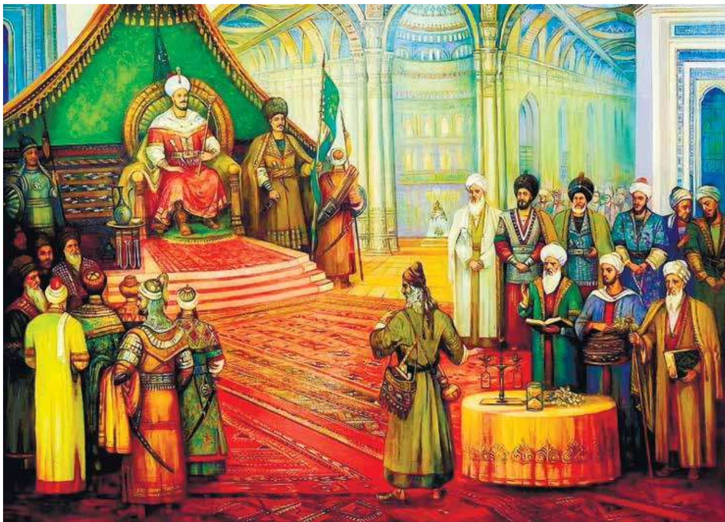
Türkmenistanyň halk suratkeşi Allamyrat Muhammedowyň «Adalatyň dabaralanmagy» atly eseri (2017 ý.).

Painting «Triumph of Justice» by National Artist of Turkmenistan Allamyrat Mukhammedov (2017).