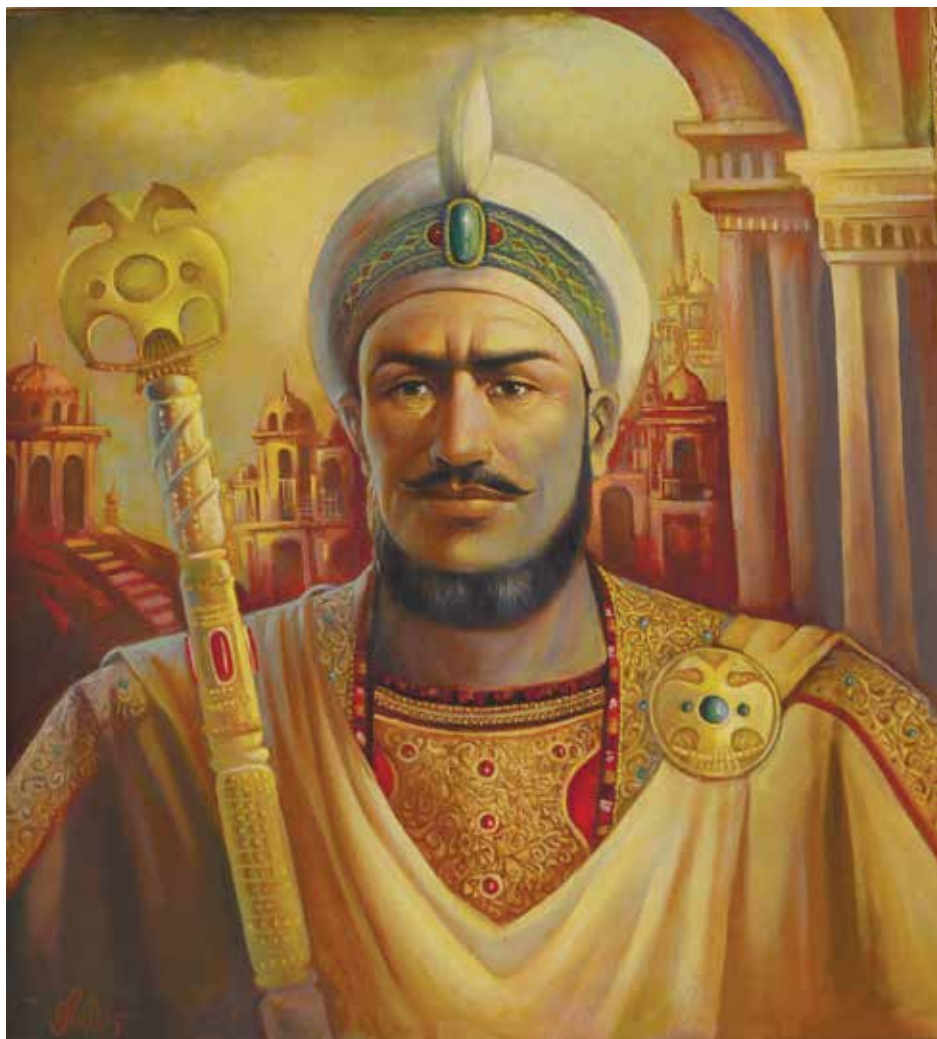
Soltan Sanjar. 2005. Kendir, ýagly boýag. Annadurdy Myradalyýew.