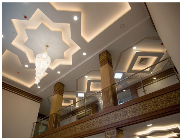
Magtymguly Pyragy adyndaky mekdep türkmen binagärlik sungatynyň ajaýyp nusgasydyr

Mälim bolşy ýaly, 2017-nji ýylda Türkmenistanda sanly bilim ulgamyny ösdürmegiň Konsepsiýasy tassyklanyldy. Bu resminama laýyklykda, ýurdumyzyň bilim edaralarynyň işini has-da kämilleşdirmek, olary ýokary hilli elektron bilim maglumatlary bilen üpjün etmek, sanly serişdeleri giňden ornaşdyrmak ugrunda uly möçberli işler alnyp barylýar. Magtymguly Pyragy adyndaky mekdebinde hem bu meselä uly üns berilýär, okuwçylaryň netijeli bilim almagy üçin mekdepde bitewi maglumat giňişligi döredildi. Şol maglumat ulgamy elektron poçtany, ýerli toruny, Internetiň mümkinçiliklerini öz içine alýar. Bu ýerde mekdebiň ýörite işlenip düzülen web sahypasy üstünlikli hereket edýär [9].