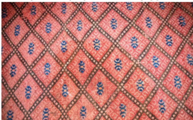
Рисунок 2 – Узор «гызлар» («девушки»)

Одним из самых трудных для исполнения мотивов является орнамент «гызлар» - девушки. Он состоит из узоров «гозенок» – решетка и «гыяк» – косая линия. «Гызлар» украшает центральное поле и кайму паласа. Рассказывают, что в процессе тканья изделия если чуть ослабить внимание, то узор не раскроется. Из-за чрезвычайной сложности узора его часто сравнивали с капризным характером молодой девушки. Существует поговорка: «Gyzlarda “gyýak” bilmedik, eňside “soýnak” bilmez.» (Кто не может выгкать «кыяк» в узоре «гызлар», не сможет исполнить узор «сойнак» в изделии энси.) Поэтому чтобы постичь все тонкости и особенности искусства изготовления безворсовых ковровых изделий, мастерицы стремились соткать безворсовый ковер с орнаментом «гызлар» [7].