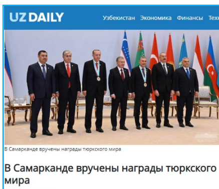
В Самарканде вручены награды тюркского мира

Недавнее проведение очередного саммита Организации тюркских государств в Узбекистане стало ярким событием на региональной политической арене. В частности, вручение нашему Герою-Аркадагу Высшего ордена тюркского мира нашло свое достойное освещение на странице узбекского новостного агентства UzDaily: